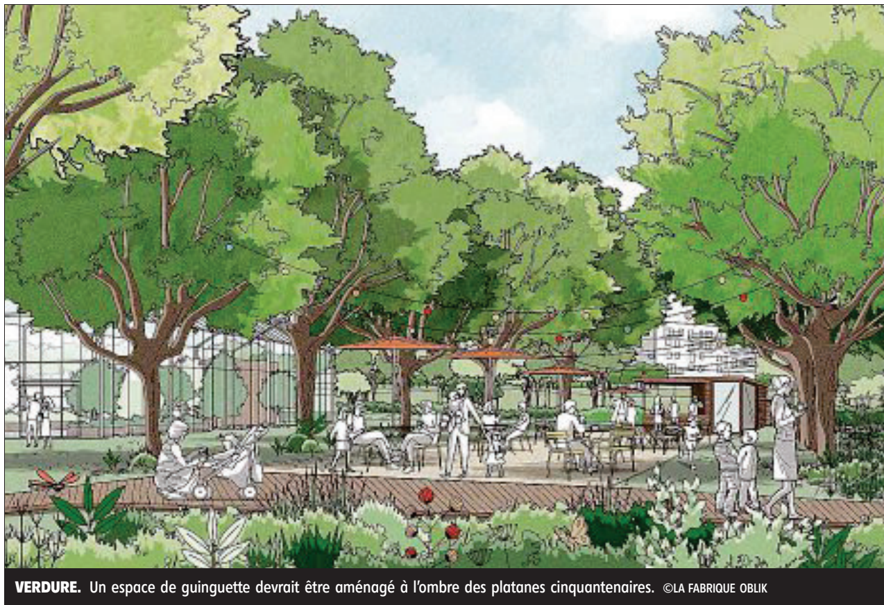
VERDURE. Un espace de guinguette devrait être aménagé à l'ombre des platanes cinquantenaires.

Selon Olivier Bianchi, maire et président de Clermont Auvergne Métropole, l'objectif final est de permettre « à cet ancien quartier à vocation industrielle d'acquiescer une di-